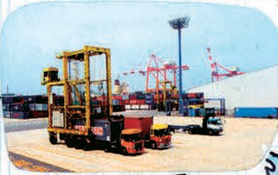
ストラドルキャリア