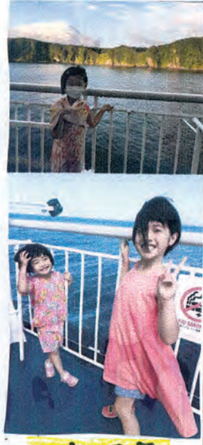
ワクワク ふねのデッキ

わたしは、ふねたびの中 で、じぶんでパンに、にく やきゅうりやゆでたまごを のせてあさごはんにしまし た。おいしかったし、たの しかったです。 わたしは、いつもまえが み。ピンでとめているので 風がつよくてもへいきでし た。でも、おねえちゃんとい いあうとは、かみがあばれ てたいへんそうでした。