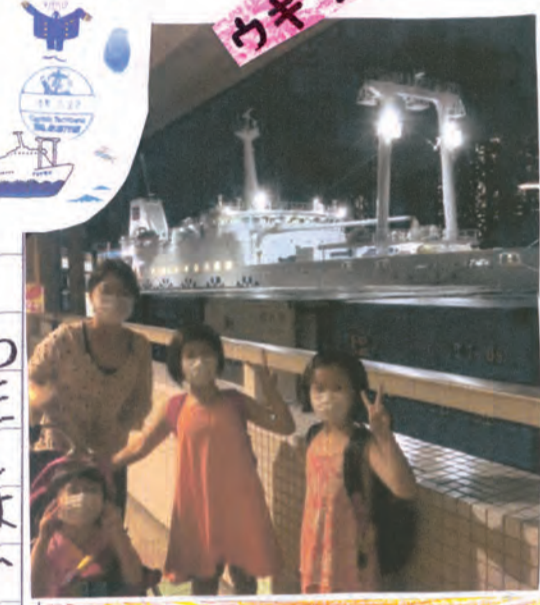
テンションマックス♡