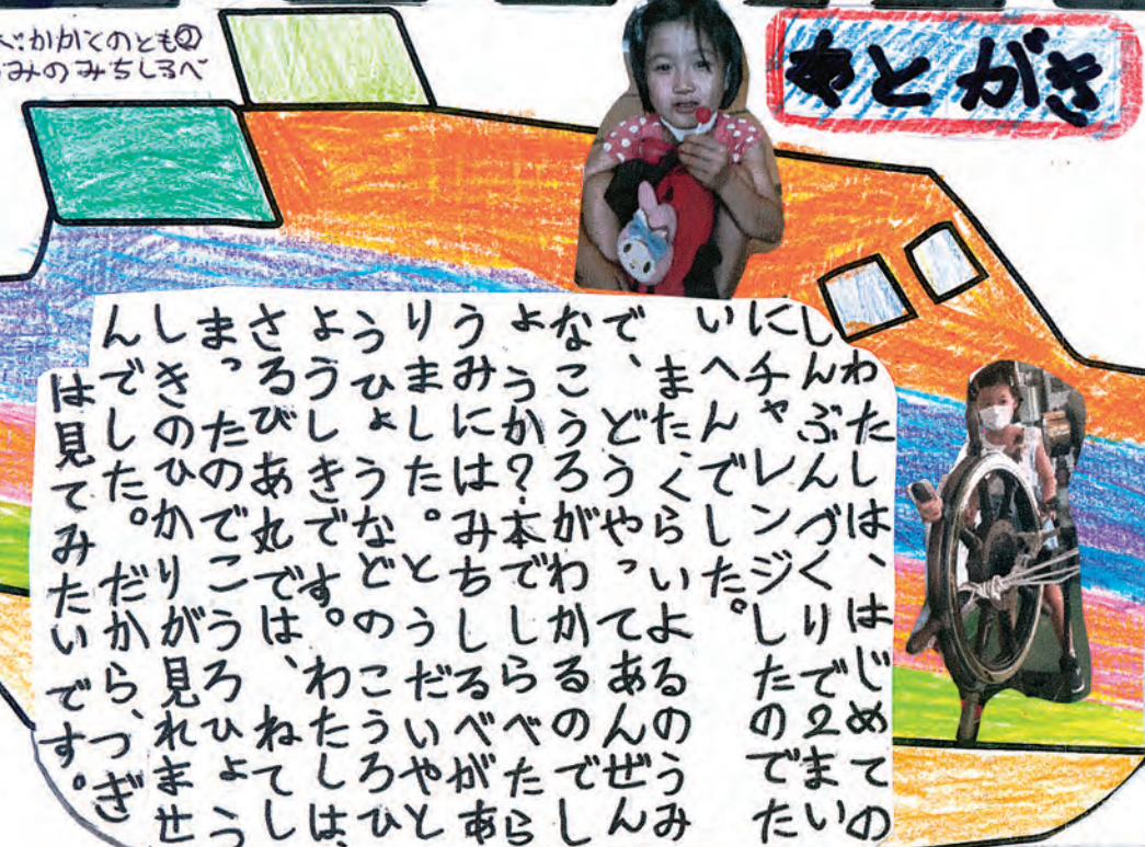
本：かかてのとも うみのみちしるべ