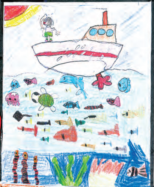
うみの中はこんなかな?

わたしは、ジェットせん にのったのは3回目です。 ジェットせんは、スピード がおそいときは、うみにう いていきます。でもこうそく になると主せん体を空に うき上がらせてすすみます。 ビッグクリしたし、かんがえ た人はすごいなとおもいま した。わたしも、みらいの やすくて、べんりで、あん ぜんなふねのしくみをかん 加えたいです。 ジェットせんはすごくは やくて、すごし目をつぶ ているあいだにつきました。 たけしばこうにとうちやく すると、大きくゆれました。