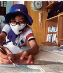
みらいへの中で海図をひいた!

周年の記念すべき も販売されました 3泊4日で乗船し 海図のひき方を、 図は一般の人でも 日々、変化する部 ても貴重なもので から、定規で現左 また、定規2つの 間に、えんぴつを はさみ、置きます。