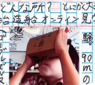
バルマウスの 形も見ました

造船所、 職人の方に 人の中、3人 槓を見る事 （ギョウデル） （ギョウデル） （ギョウデル）