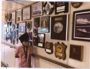
変わった珍しい酒

た酒がありました。 こいまで寄港し した。船の中は を鳴らしてくれま いた。飛鳥IIも汽笛 を鳴らしてくれま した。船の中は こいまで寄港し た。