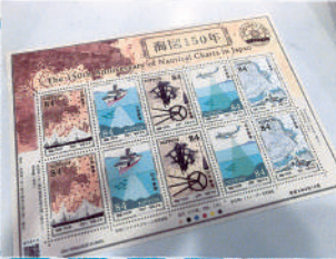
海図150周年記念切手

今年には深田150 年です。記念切手 帆船みらい人に 実習生の皆さんと 勉強しました。海 陸入できませんが、 分が沢山あり、と す。GPSを見な 位置を確認します。