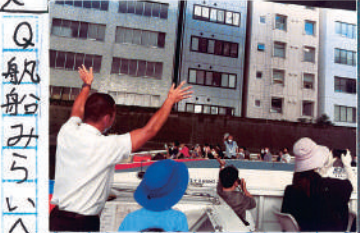
石橋にも注目 水の都 東京。

西条工場のオンラ トリーツアーを体 ブライアスクレー ンヤ、船体パーツ を持ち上げマグネ ットクレーン、デ ッキクレーン、プ ロダクトキャリア など、力持ちの機 が由来しました。百 位の上向き溶接の 逢ってみたいで