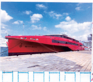
がんばれ新造船 クイーンビートル

クイーンビートル を見学してきまし た。オーストラリ アで造られた赤い トリマラン型の船 内は、バリアフリ ーの通路や、自転 車置き場がありま す。船旅が見直さ れている今、サイ クリンゲ目的の方