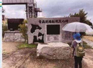
合掌見学、見学しました。ぼたるの光が流れます。

青函連絡船を観に、 横浜には港の近く 残っています。昔 船に運ばれたから 田丸を観ると、鉄 まま船へと続くよ