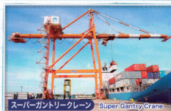
スーパーガントリークレーン Super Gantry Crane