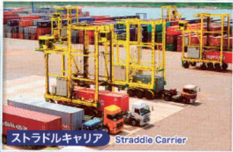
ストラドルキャリア Straddle Carrier