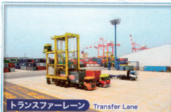
トランスファーレーン Transfer Lane