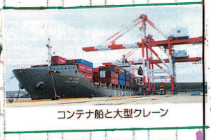
コンテナ船と大型クレーン