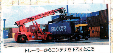
トレーラーからコンテナを下すところ

「コンテナって何？」 コンテナは私たちが身の回りの品から工業製品まで様々なものを運ぶのに使われています。コンテナ船は世界中の港をめぐります。トレーラーからコンテナを下すところ