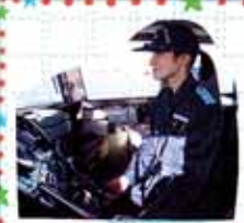
操船中の船長さん

が発生しています。国民が安心して海を利用できるように、関係国との連携・協力関係の強化を図りつつ、領海警備、海難救助、環境保全、海洋調査、船舶の航行安全等の活動に日夜従事しています。