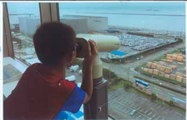
川崎マリエンの展望室にて