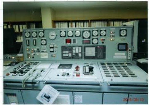
(写真はエンジンコントロール室。この部屋のおくのとびらのおくに、エンジン室に入るためのかいだいがある。)