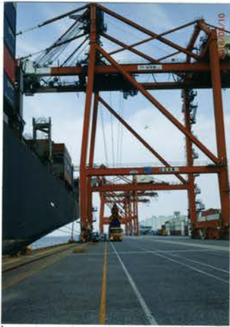
(ガントリークレーン)

い か 予 が の 本 の 運 4 最 大 ト リ ー ・ ク レ ー ン た っ 想 か に の の べ 台 大 び ー ・ ク 。 た よ る ' コ ン 。 動 時 間 レ の リ 。 最 短 テ っ す る か ら 本 と で も 見 短 て ナ ま り 運 9000 の い ' 動 て で 56 時 間 ぐ 4000 の い お き み 56 時 間 ぐ 4000 の い どのがうる時問ぐ4000のい