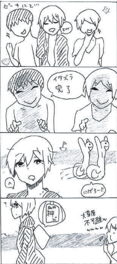
漫画担当：小宮 朋華

船上の意外な施設、いかがですか？しかし、これはまだほんの一部。機会があったら実際に体験してみてくださいね。