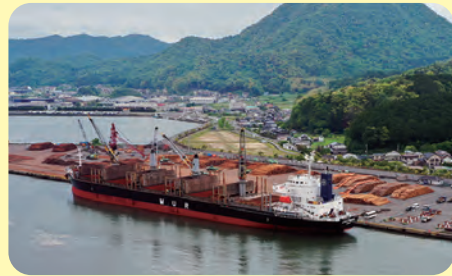
ばら積み船(5)喜多ふ頭