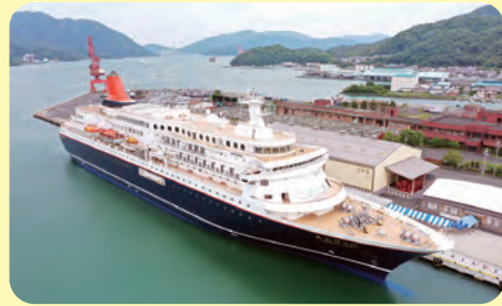
クルーズ船(2)第2ふ頭