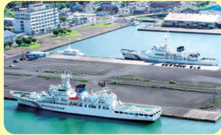
海上保安庁巡視船(3)第3ふ頭