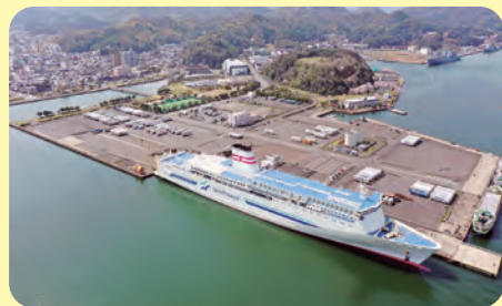
国内フェリー(新日本海フェリー(株)) (7)前島ふ頭