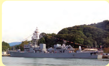
護衛艦(6)海上自衛隊基地