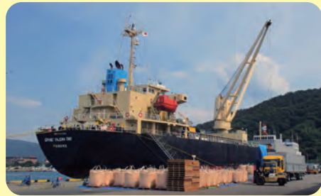
クレーン船(4)第4ふ頭