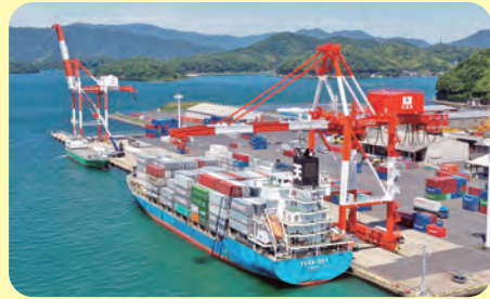
コンテナ船(1)舞鶴国際ふ頭